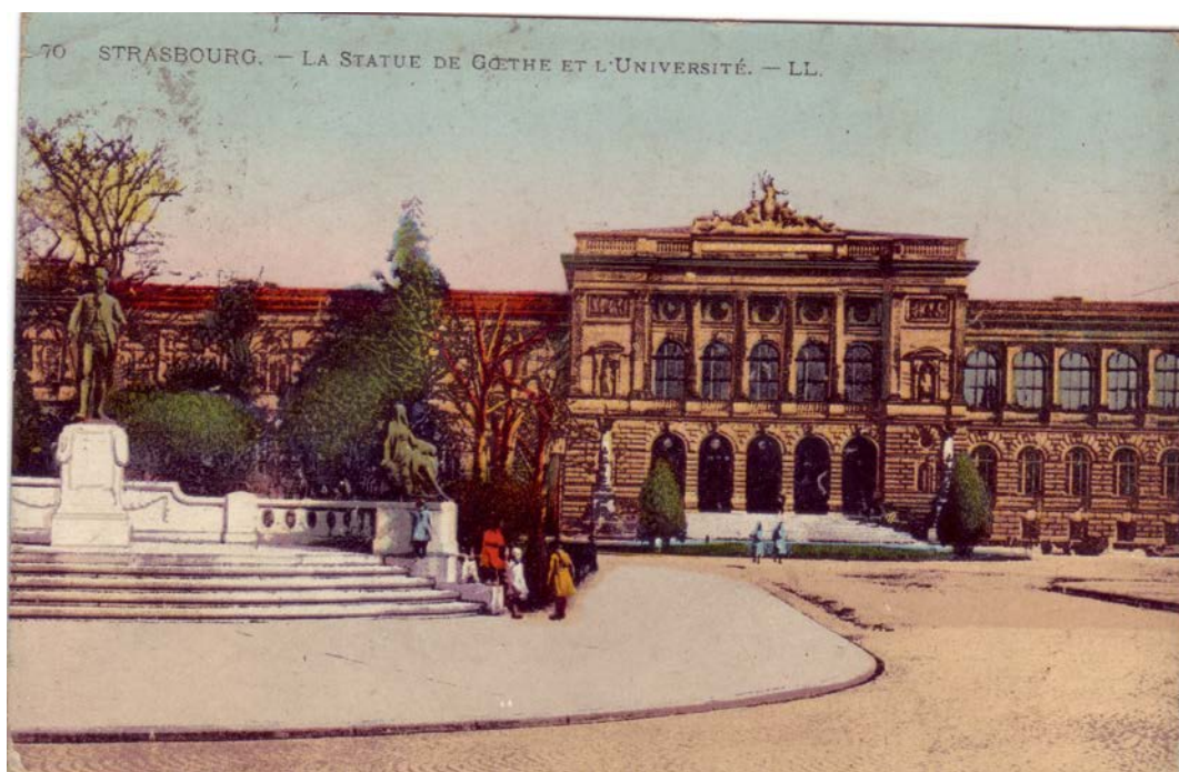
Le Palais universitaire entre 1919 et 1939

[Pour localiser tout bâtiment sur le campus, consulter http://mob.u-strasbg.fr/geoloc/ ]