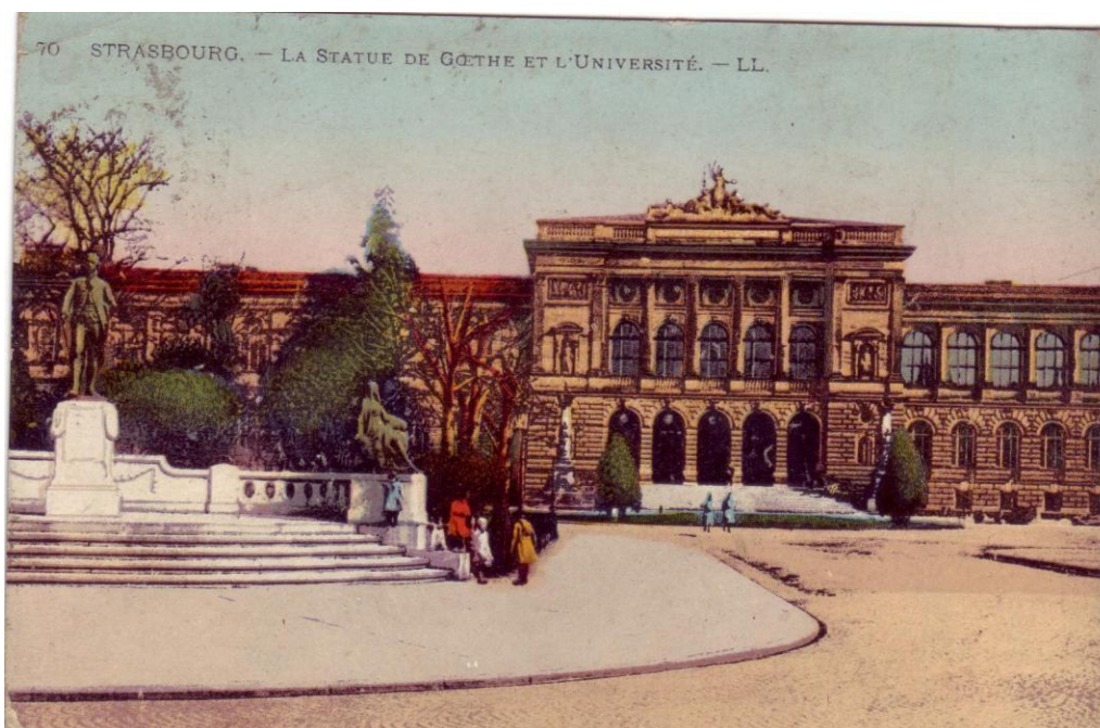
Le Palais universitaire entre 1919 et 1939

[Pour localiser tout bâtiment sur le campus, consulter http://mob.u-strasbg.fr/geoloc/ ]