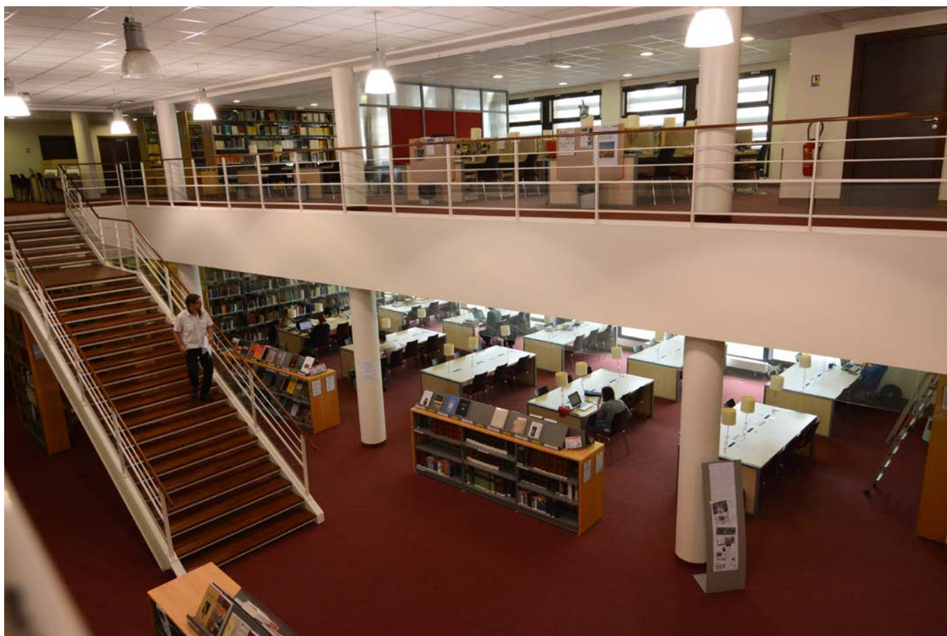
La bibliothèque de la MISHA